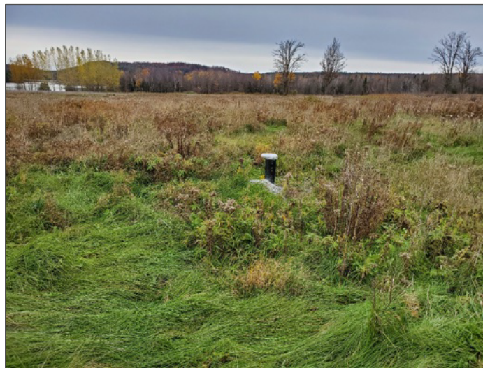
Puits sur le Site.