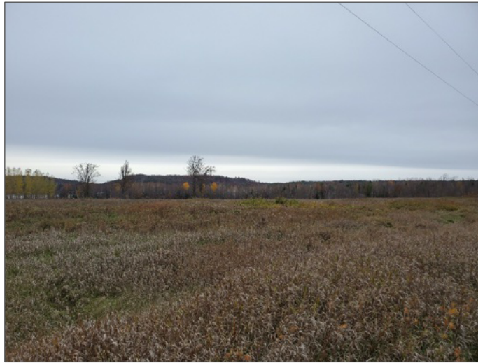
Aperçu du Site.