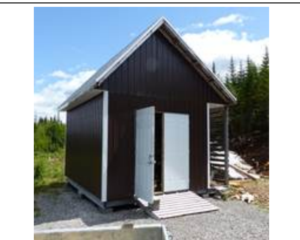
Photo 10. Remise sur le même terrain que le chalet situé sur le site à l'étude (lac du Chicot)