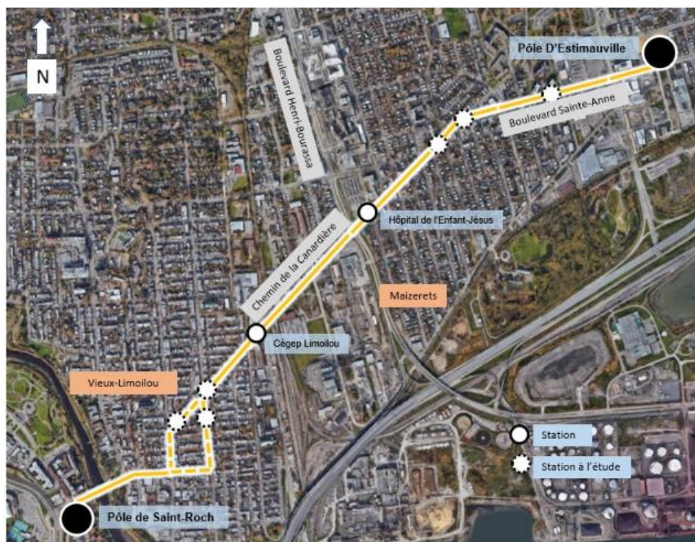
Figure 2. Localisation du tracé du pôle de Saint-Roch au pôle D'Estimauville

Des séances de participation publique sont également prévues afin de recueillir les préoccupations et recommandations des citoyens quant à la variante à l'étude et la localisation des stations.