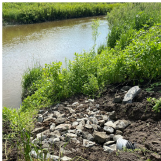
Exutoire des drains agricoles à la rivière L'Acadie.

Enfin, des travaux de forage d'un puits ont été réalisés pour permettre l'installation d'un système d'irrigation nécessaire au démarrage d'une petite exploitation maraîchère sur une partie du site. Malheureusement, ce forage n'a pu permettre de trouver de l'eau, ce qui a remis en question ce projet.