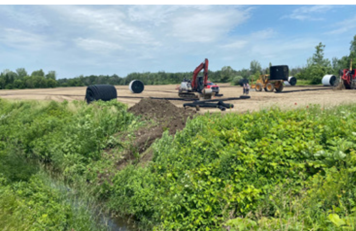
Pose de drains agricoles sur la propriété de Carignan.

Dans un premier temps, l'installation d'un réseau de drains agricoles, le retrait de débris dans le ruisseau traversant la propriété, le remodelage de fossés, le remplacement d'un ponceau et le nivellement du terrain permettront un meilleur écoulement de l'eau. Le drainage des terres améliorera le rendement des cultures agricoles, notamment lors des années où l'on recense de nombreux orages provoquant l'inondation des champs.