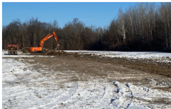
Enfouissement d'un fossé sur la propriété de Carignan.

Par ailleurs, la Fiducie est intervenue en Cour supérieure pour contester les prétentions d'un voisin revendiquant la possession d'une partie de la propriété de Carignan pour un usage résidentiel. Ce dossier sera entendu l'année prochaine suivant une décision de la Cour d'appel qui sera rendue dans un dossier similaire.