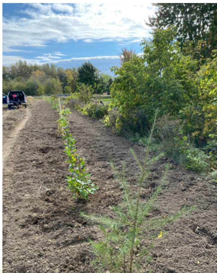
Travaux d'élargissement de la bande riveraine pour éviter l'affaissement du terrain dans le ruisseau longeant la propriété de Carignan.

Un conseil de fiduciaires est chargé de la maîtrise et de l'administration du patrimoine de la Fiducie. Ces fiduciaires sont désignés par l'Union des producteurs agricoles (UPA) et par Projet REM S.E.C.