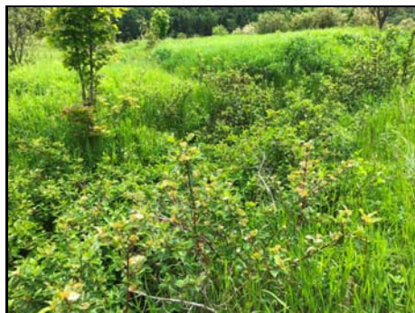
Site traversée projeté