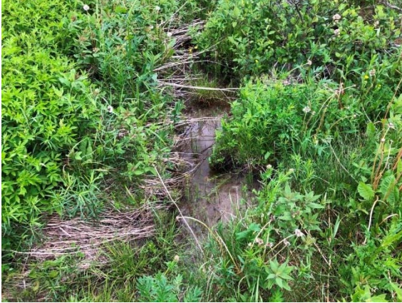
Photo 3.15 Section aval du site de traversée projeté du cours d'eau 8-HP-NLP (ch.: 4+513) (juin 2021)