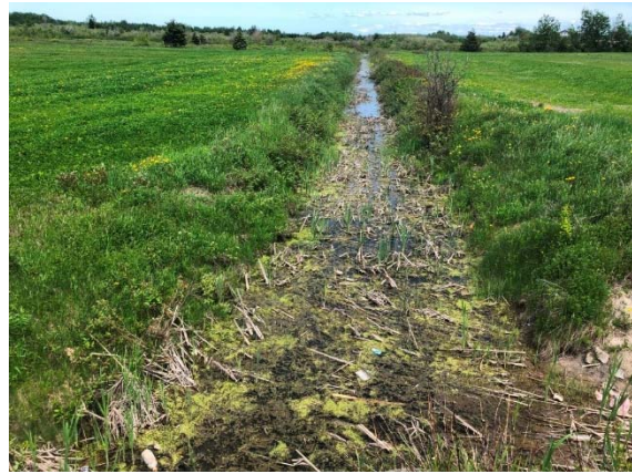
Photo 3.6 Ponceau existant à démanteler, vue vers l'aval (juin 2022)