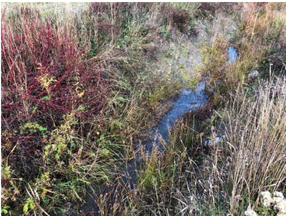
Photo 3.9 Section amont du cours d'eau 6-HP-NLP-Rivière Harton (octobre 2021)