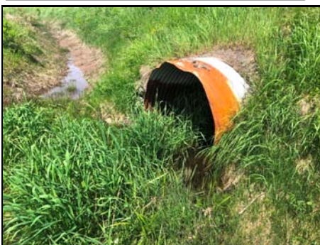
Extrémité aval du ponceau