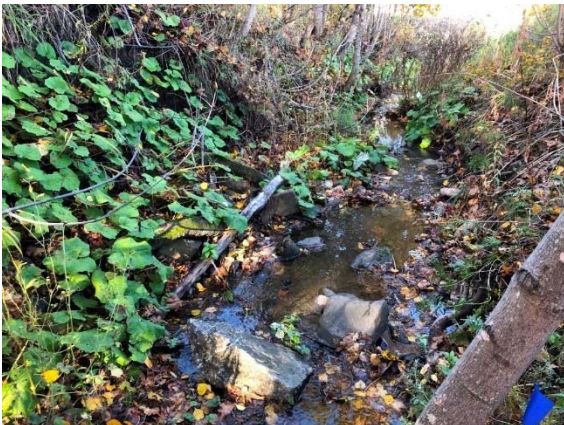
Photo 3.19 Section amont du cours d'eau 8-HP-NLP (ch.: 30+448) (octobre 2021)