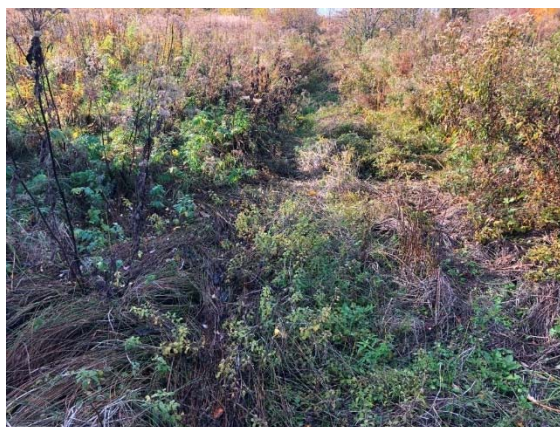
Photo 3.22 Site de traversée projeté 10-HP-NLP (ch. : 5+051) (octobre 2021)