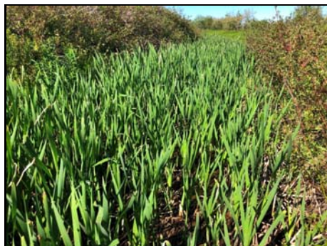
Lit du cours d'eau colonisé par le typha