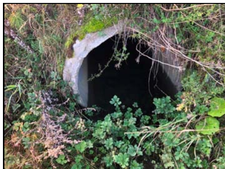
Extrémité aval du ponceau