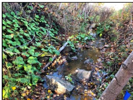
Section amont du cours d'eau

Habitat du poisson (O/N) oui Fonction d'habitat alimentation Abri • rive en porte-à-faux faible • blocs ou galets moyen • débris ligneux faible • végétation en surplomb faible Fosse nul Obstacle à la circulation du poisson Obstacle infranchissable à l'aval, et faible qualité de l'habitat Degré: - lat_obs: - long_obs: - Libre passage (O/N) non Lat/long hdd° m' ss.s" (NAD83) Espèces potentielles de poisson