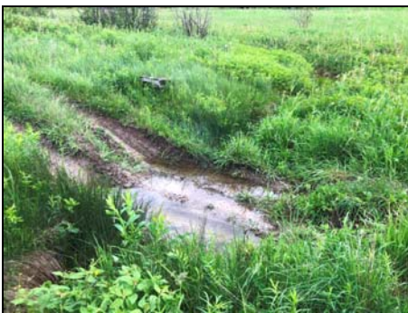
Traverse à gué de VTT