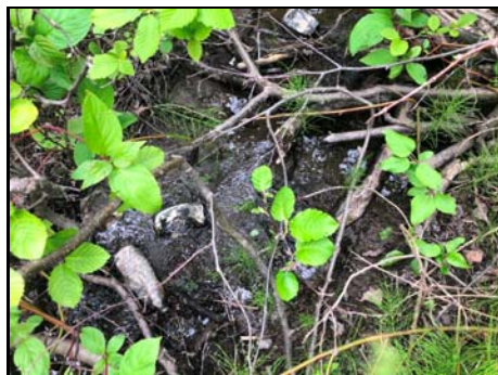
Lit d'écoulement dans la section aval