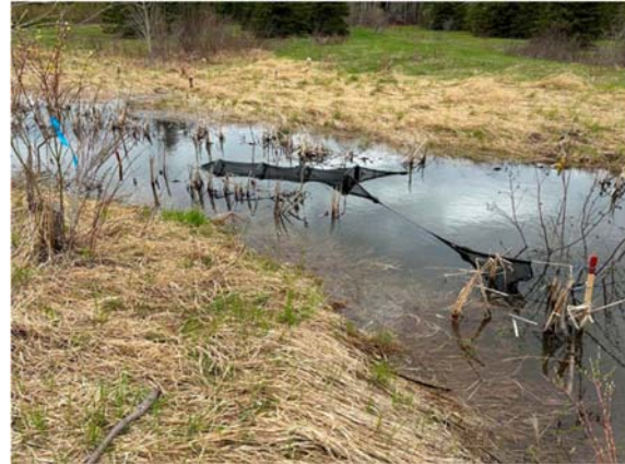
Photo 2.2 Verveux mis en place en aval du site 6-HP-NLP-Rivière Harton (15 mai 2023)