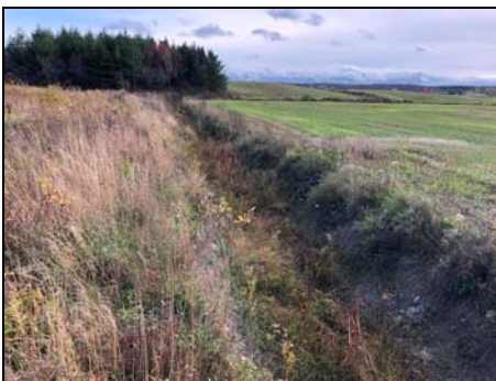
Section amont asséchée