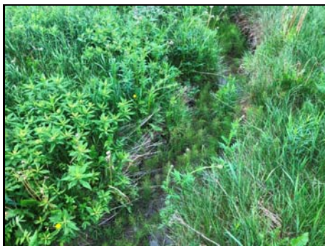
Présence de végétation aquatique