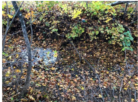
Photo 3.40 Section amont du site 11B-NHP-NLP (ch. : 5+305) (octobre 2021)