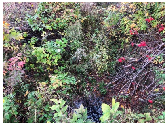
Photo 3.26 Section aval du site 11A-NHP-NLP (ch. : 251+012) (juin 2021)