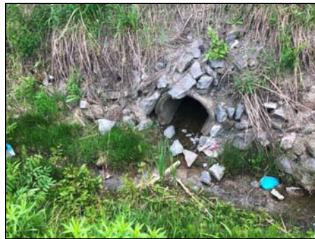
Extrémité amont du ponceau