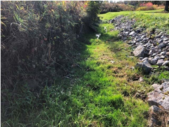
Photo 3.17 Section amont du cours d'eau 8-HP-NLP (ch.: 5+266) (octobre 2021)