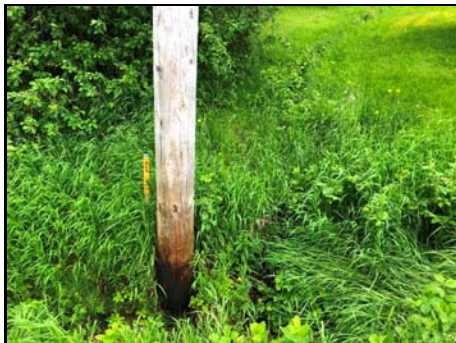
Section amont du 2e rang ouest

Habitat du poisson (O/N) non Fonction d'habitat aucune Abri • rive en porte-à-faux faible • blocs ou galets nul • débris ligneux faible • végétation en surplomb faible Fosse nul Obstacle à la circulation du poisson Absence d'habitat du poisson Degré: lat_obs: - long_obs: - Libre passage (O/N) non Lat/long hdd° m' ss.s" (NAD83) Espèces potentielles de poisson