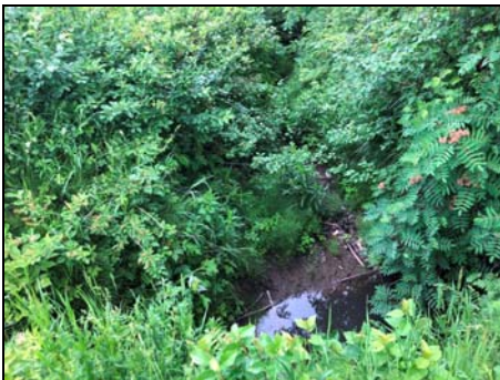
Section aval du 2e rang ouest