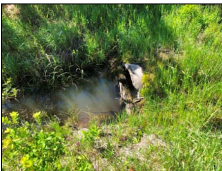
Petit ponceau en béton