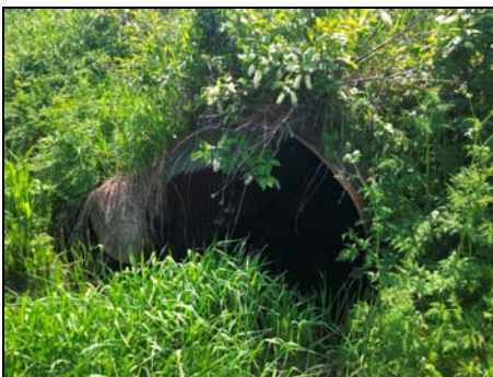
Extrémité amont du ponceau