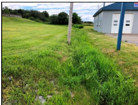
Section amont de la rte 293 existante