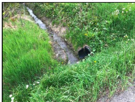
Écoulement provenant du fossé nord-ouest

Habitat du poisson (O/N) oui Fonction d'habitat alimentation Abri • rive en porte-à-faux faible • blocs ou galets nul • débris ligneux faible • végétation en surplomb moyen Fosse nul Obstacle à la circulation du poisson Absence d'habitat à l'amont Degré: - lat_obs: - long_obs: - Libre passage (O/N) non Lat/long hdd° m' ss.s" (NAD83) Espèces potentielles de poisson