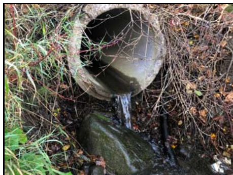
Extrémité aval du ponceau