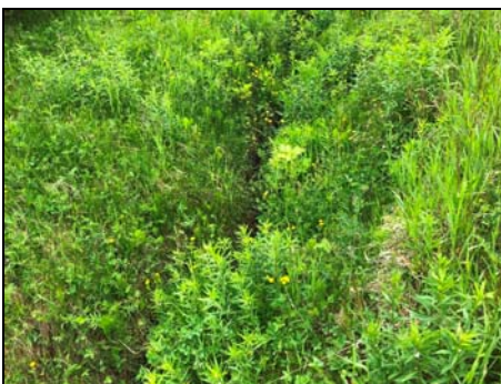
Site traversée projeté