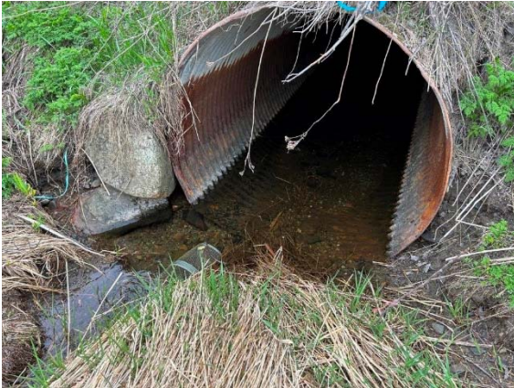
Photo 2.1 Bourolle mise en place en aval du site 1-HP-NLP (15 mai 2023)

En raison de la faible taille des cours d'eau, les pêches ont été réalisées à l'aide de bourolles appâtées et d'un verveux (tableau 2.1). Ces engins de pêche passifs ont été installés le 15 mai 2023 (avant le crépuscule) et ils ont été retirés le lendemain matin, pour un effort d'une nuit-pêche. Ces engins étaient particulièrement bien adaptés à la capture de poissons de petite taille, qui sont susceptibles de fréquenter les cours d'eau de la zone d'étude.