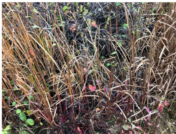
Photo 3.4 Lit du cours d'eau au droit du site 5-HP-NLP-Branche de la Montagne (octobre 2021)