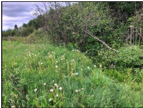
Site de traversée projeté

Habitat du poisson (O/N) oui Fonction d'habitat alimentation Abri • rive en porte-à-faux faible • blocs ou galets nul • débris ligneux faible • végétation en surplomb faible Fosse nul Obstacle à la circulation du poisson Faible superficie et faible qualité de l'habitat à l'amont Degré: n/a lat_obs: - long_obs: - Libre passage (O/N) non Lat/long hdd° m' ss.s" (NAD83) Espèces potentielles de poisson