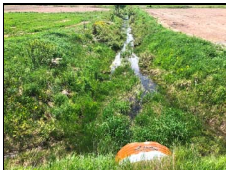
Section aval du cours d'eau