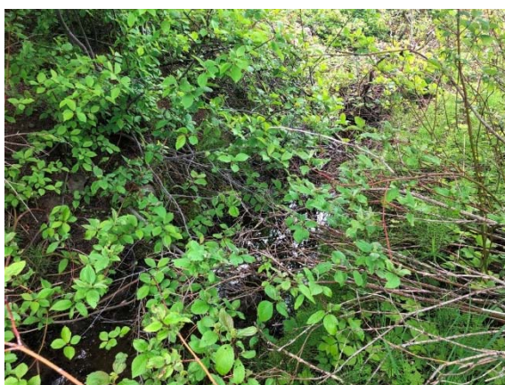
Photo 3.11 Section aval du site 7-HP-NLP-Rivière Renouf-B (juin 2022)

Le cours d'eau 7 possède un bassin versant d'une superficie de 9,37 ha. Ce cours d'eau est intermittent et il n'est apparent qu'en aval de la route 293 actuelle (photos 3.11 et 3.12). Le faciès d'écoulement est de type seuil dans sa section aval. Ce cours d'eau est en partie alimenté par les eaux provenant du fossé nord-ouest de la route existante et par les fossés à l'est de la route. Le substrat est constitué de sable, de limon et de matière organique. Lors des relevés, la profondeur d'eau était de 0,1 m. La LDPB était de 1,5 m et la LL de 3,0 m dans sa section aval. La pente du cours d'eau est d'environ 2,9 %. Ce cours d'eau pourrait être utilisé par les poissons pour l'alimentation en présence d'écoulement. Cependant, la section amont ne constitue pas un habitat du poisson. Pour ces raisons, le libre passage du poisson dans le ponceau à mettre en place n'est pas requis.