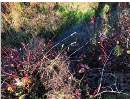
Mince écoulement observé