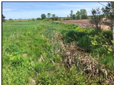
Section amont du cours d'eau

Habitat du poisson (O/N) oui Fonction d'habitat alimentation Abri • rive en porte-à-faux faible • blocs ou galets nul • débris ligneux faible • végétation en surplomb faible Fosse nul Obstacle à la circulation du poisson Faible superficie et faible qualité de l'habitat à l'amont Degré: - lat_obs: - long_obs: - Libre passage (O/N) non Lat/long hdd° m' ss.s" (NAD83) Espèces potentielles de poisson cyprinidés