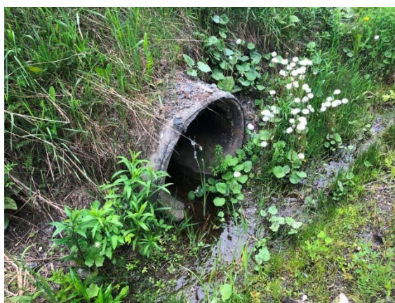
Photo 3.12 Section amont du site 7-HP-NLP-Rivière Renouf-B (juin 2022)