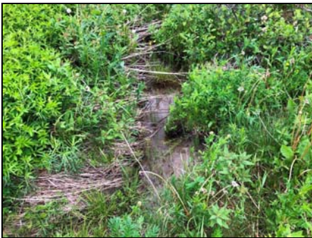
Petit lit d'écoulement observé