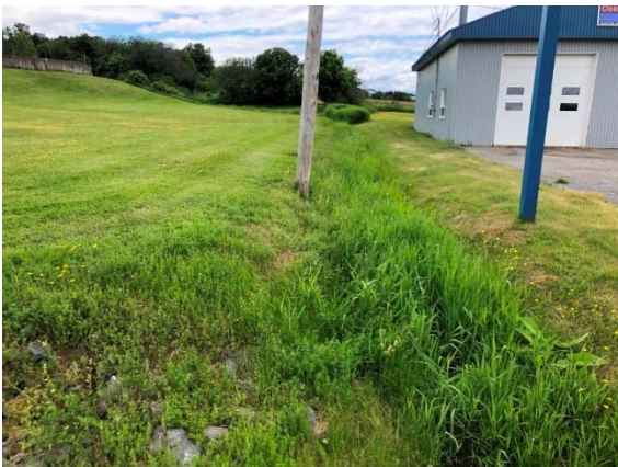
Photo 3.27 Section amont du site 11A-NHP-NLP (ch. : 5+495) (juin 2021)