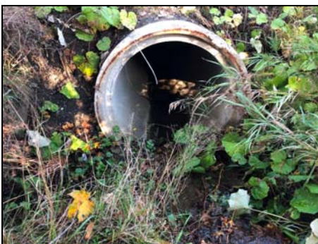
Extrémité amont du ponceau