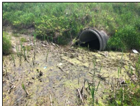
Extrémité aval du ponceau