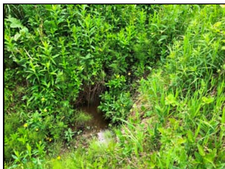
Présence d'un petit lit d'écoulement

Habitat du poisson (O/N) oui Fonction d'habitat aucune Abri • rive en porte-à-faux faible • blocs ou galets nul • débris ligneux faible • végétation en surplomb faible Fosse nul Obstacle à la circulation du poisson Absence d'habitat du poisson Degré: - lat_obs: - long_obs: - Libre passage (O/N) non Lat/long hdd° m' ss.s" (NAD83) Espèces potentielles de poisson