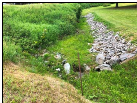
Vue vers l'amont

Habitat du poisson (O/N) oui Fonction d'habitat alimentation Abri • rive en porte-à-faux faible • blocs ou galets moyen • débris ligneux faible • végétation en surplomb faible Fosse nul Obstacle à la circulation du poisson Faible superficie et faible qualité de l'habitat à l'amont Degré: n/a lat_obs: - long_obs: - Libre passage (O/N) non Lat/long hdd° m' ss.s" (NAD83) Espèces potentielles de poisson