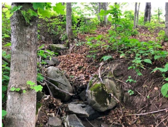
Photo 3.24 Section en aval du ponceau d'accès privé du cours d'eau 10-HP-NLP (juin 2021)