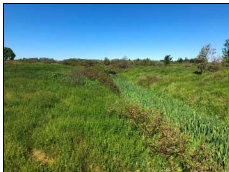
Site de traversée projeté

Habitat du poisson (O/N) oui Fonction d'habitat alimentation Abri • rive en porte-à-faux faible • blocs ou galets nul • débris ligneux faible • végétation en surplomb faible Fosse nul Obstacle à la circulation du poisson Faible superficie et faible qualité de l'habitat à l'amont Degré: - lat_obs: - long_obs: - Libre passage (O/N) non Lat/long hdd° m' ss.s" (NAD83) Espèces potentielles de poisson