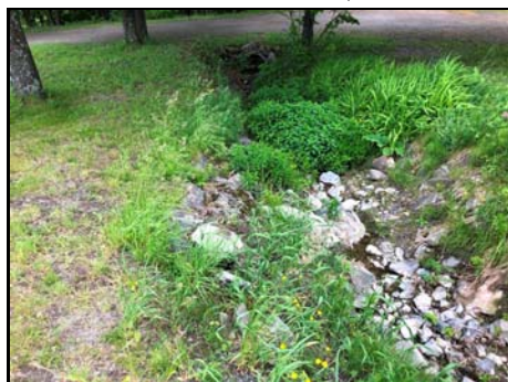
Section entre la route 293 et le chemin d'accès

Habitat du poisson (O/N) oui Fonction d'habitat aucune Abri • rive en porte-à-faux faible • blocs ou galets moyen • débris ligneux faible • végétation en surplomb faible Fosse nul Obstacle à la circulation du poisson Absence d'habitat du poisson Degré: n/a lat_obs: - long_obs: - Libre passage (O/N) non Lat/long hdd° m' ss.s" (NAD83) Espèces potentielles de poisson