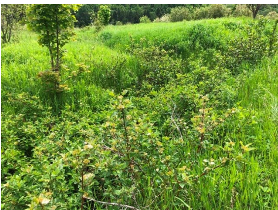
Photo 3.21 Site de traversée projeté 10-HP-NLP (ch. : 5+051) (juin 2021)

Le cours d'eau 10 possède un petit bassin versant de 14,62 ha. Ce cours d'eau est intermittent puisqu'il est asséché la majeure partie de l'année (photos 3.21 et 3.22). Celui-ci est actuellement traversé par la route 293 existante et par un ponceau pour l'accès à une résidence privée. D'ailleurs, en aval de ce dernier, la pente du cours d'eau y est forte et il y a présence successive d'obstacles naturels infranchissables d'une hauteur de plus de 0,5 m (photos 3.23 et 3.24). Au droit de la route existante, la pente du cours d'eau est de 4,8 % et celle-ci s'accroît vers l'amont pour atteindre environ 6,0 % au droit du site de traversée de la route 293 projetée. Ce cours d'eau présente un écoulement de type rapide et de type cascades plus en aval. Le substrat est composé de limon, d'argile et de sable dans sa section amont et de cailloux, de blocs et de galets dans sa section aval. La LDPB varie entre 0,7 m et 1,4 m et la LL varie de 1,7 m à 2,6 m. Ce cours d'eau constitue très faible potentiel d'habitat du poisson puisqu'il s'assèche la majeure partie de l'année, qu'il présente une forte pente avec présence d'obstacles et qu'aucun poisson ne peut provenir de l'aval. Le libre passage du poisson n'est pas requis.