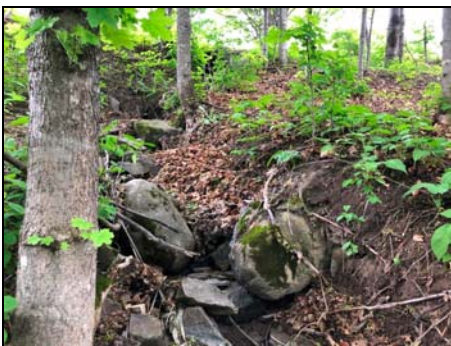
Section infranchissable à l'aval