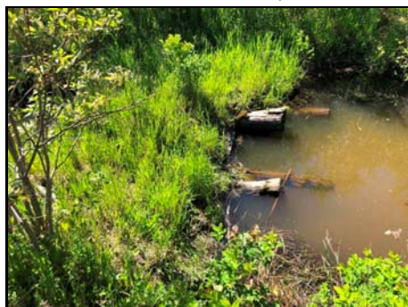
Pont en bois qui entrave l'écoulement

Habitat du poisson (O/N) oui Fonction d'habitat alimentation Abri • rive en porte-à-faux faible • blocs ou galets nul • débris ligneux faible • végétation en surplomb faible Fosse nul Obstacle à la circulation du poisson Section asséchée à 200 m en amont, Faible qualité d'habitat Degré: - lat_obs: - long_obs: - Libre passage (O/N) non Lat/long hdd° m' ss.s" (NAD83) Espèces potentielles de poisson