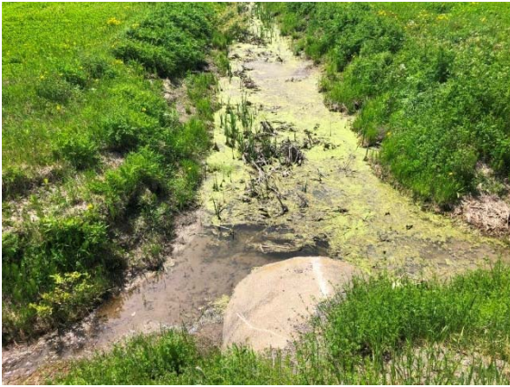
Photo 3.5 Ponceau existant à démanteler, vue vers l'amont (juin 2022)