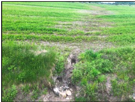
Section en amont du ponceau

Habitat du poisson (O/N) oui Fonction d'habitat aucune Abri • rive en porte-à-faux faible • blocs ou galets nul • débris ligneux faible • végétation en surplomb faible Fosse nul Obstacle à la circulation du poisson Faible qualité et absence d'habitat à l'amont Degré: n/a lat_obs: - long_obs: - Libre passage (O/N) non Lat/long hdd° m' ss.s" (NAD83) Espèces potentielles de poisson