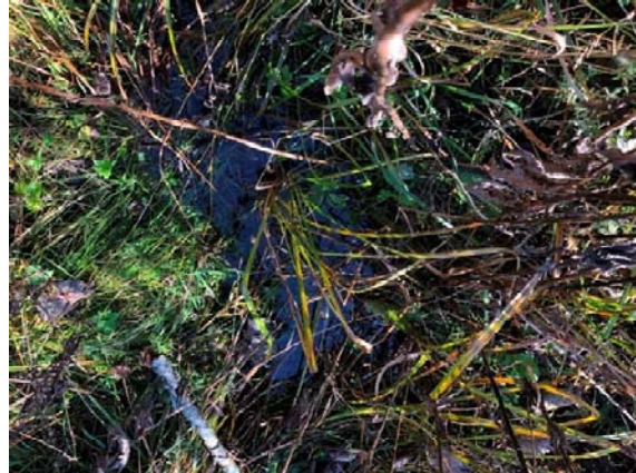
Photo 3.16 Faible écoulement au site de traversée projeté du cours d'eau 8-HP-NLP (ch.: 4+513) (octobre 2021)