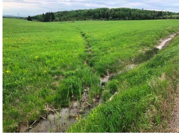
Photo 3.14 Section aval du site 7-HP-NLP- Rivière Renouf-A (juin 2022)