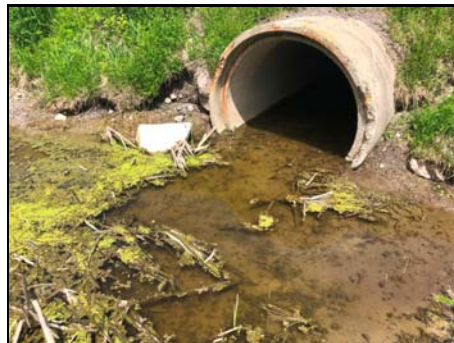
Extrémité amont du ponceau