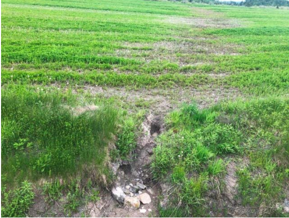
Photo 3.13 Section amont du site 7-HP-NLP- Rivière Renouf-A (juin 2022)