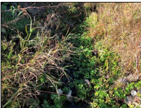
Section aval du cours d'eau