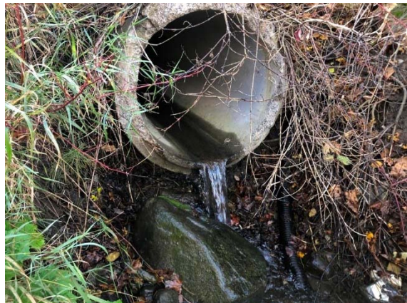
Photo 3.20 Extrémité aval du ponceau du 2° Rang Est au droit du cours d'eau 8-HP-NLP (ch.: 30+448) (octobre 2021)