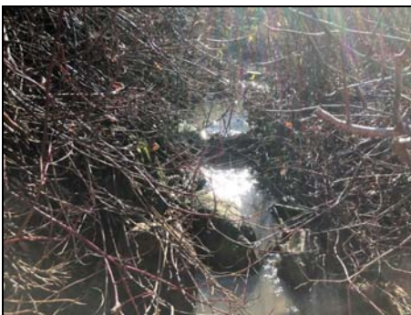
Section aval du cours d'eau