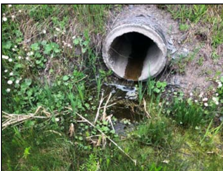
Extrémité aval du ponceau