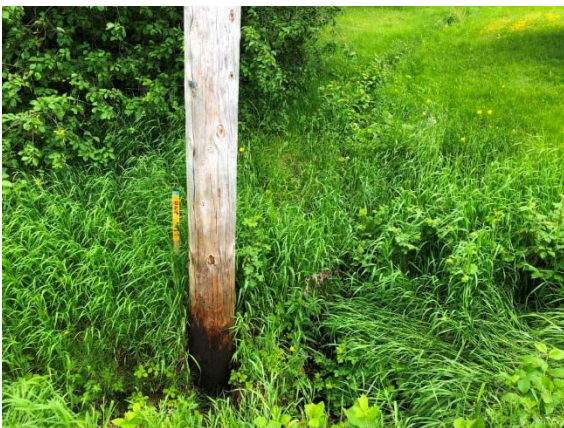
Photo 3.25 Section amont du site 11A-NHP-NLP (ch. : 251+012) (juin 2021)

Le cours d'eau 11 possède un bassin versant d'une superficie d'environ 17 ha. Ce cours d'eau est intermittent et il s'écoule en partie sur un terrain résidentiel en amont du 2 e rang Ouest, puis en bordure d'un champ agricole ainsi que par le fossé en bordure du garage municipal avant d'être capté dans une conduite pluviale (photos 3.25 et 3.28). Le substrat est constitué de limon, de sable, et de gravier. Lors des relevés, la profondeur d'eau était de 0,05 m, la LDPB était de 0,5 m et la LL de 1,6 m. Ce cours d'eau ne peut être utilisé par les poissons notamment en raison de sa canalisation en conduite pluviale. Pour ces raisons, le libre passage du poisson dans le ponceau à mettre en place n'est pas requis.