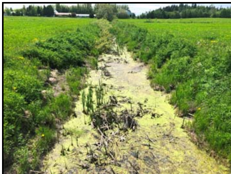
Section amont du cours d'eau