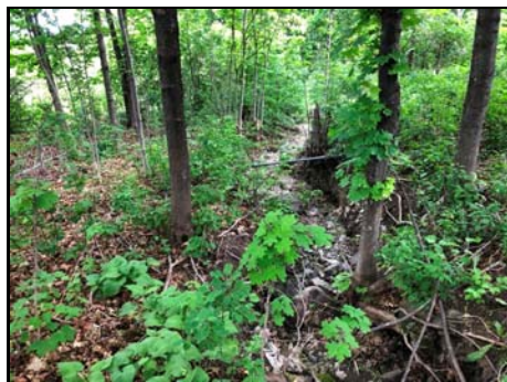
Vue vers l'aval de la section aval