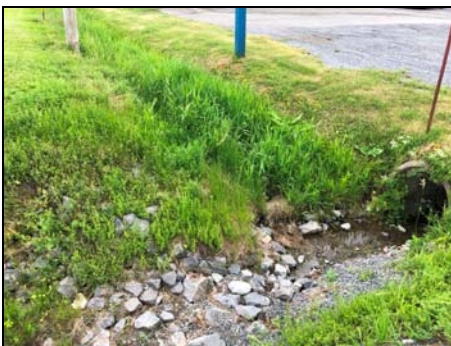
Section amont de la rte 293 existante