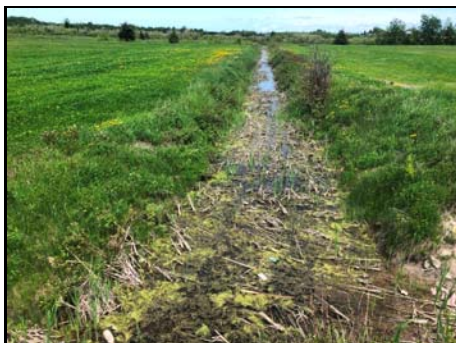
Section aval du cours d'eau