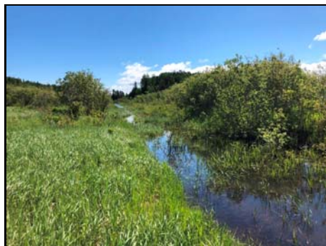
Vue du site de traversée