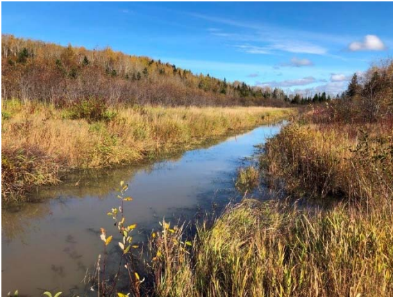
Photo 3.7 Site de traversée du cours d'eau 6-HP-NLP-Rivière Harton (octobre 2021)