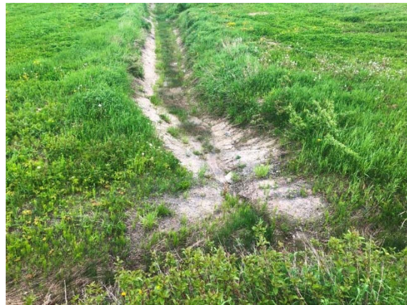
Photo 3.10 Section asséchée en amont du cours d'eau 6-HP-NLP-Rivière Harton (juin 2022)