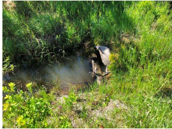
Photo 3.8 Ponceau en béton présent sur le 6-HP-NLP-Rivière Harton (juin 2021)