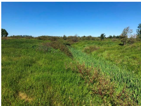
Photo 3.3 Site de traversée projeté au droit du site 5-HP-NLP-Branche de la Montagne (juin 2021)

La principale fonction de l'habitat du poisson est l'alimentation. En raison des caractéristiques de ce cours d'eau et de la faible qualité de l'habitat du poisson, le libre passage du poisson a été jugé comme étant non requis.