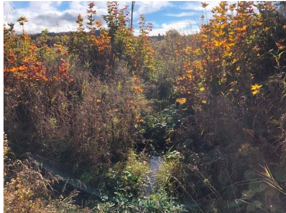
Photo 3.18 Section aval du cours d'eau 8-HP-NLP (ch.: 5+266) (octobre 2021)