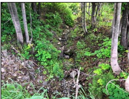
Section en amont de la route 293