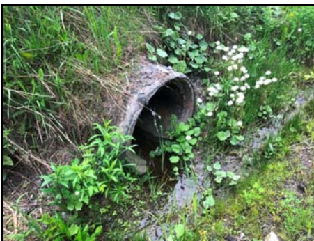
Extrémité amont du ponceau