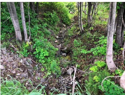
Photo 3.23 Section amont du cours d'eau 10-HP-NLP au droit de la route 293 existante (ch. : 151+241) (juin 2021)