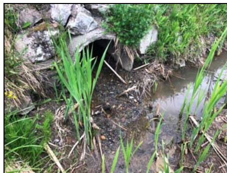
Extrémité aval du ponceau