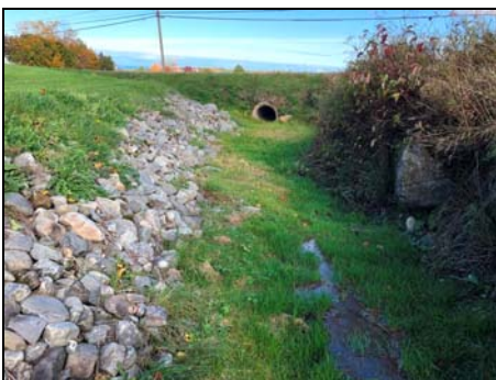
Section amont, vue vers l'aval