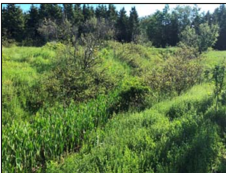
Vue vers l'aval du site de traversée