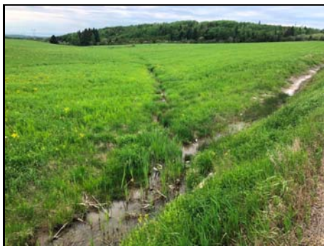
Section aval du cours d'eau