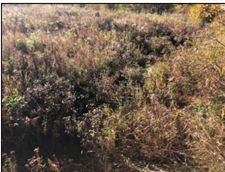
Site traversée projeté