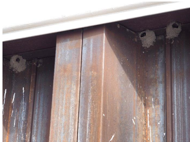
Photo 6 Trois nids observés sous le rebord du côté sud de la tête du quai (24 juin 2022)