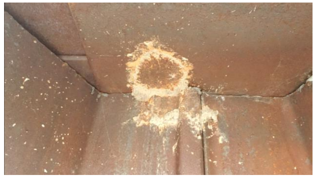
Photo 10 Marques de présence d'un ancien nid (côté nord-est; 20 octobre 2022)