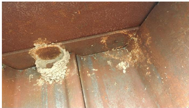
Photo 9 Un nid incomplet et marques de présence d'un ancien nid (côté sud; 20 octobre 2022)