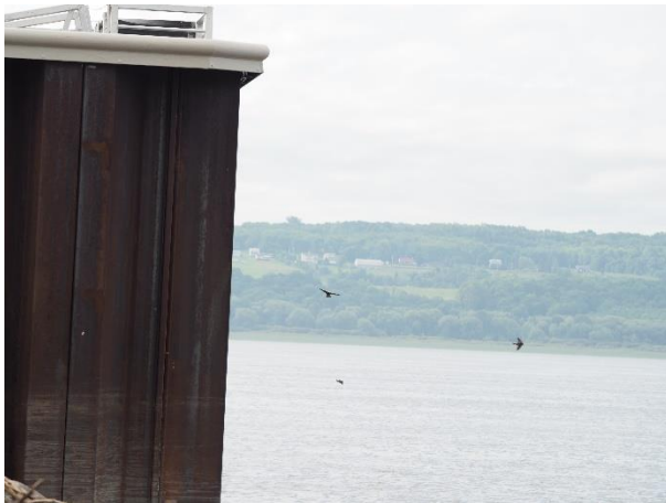
Photo 1 Hirondelles à front blanc en vol autour de la tête du quai (24 juin 2022)

Il a pu être confirmé que des nids étaient présents sur trois faces de la tête du quai, sans pouvoir faire leur dénombrement complet. Lors de cette visite, il a été possible de descendre sur la nouvelle plateforme flottante d'embarquement du quai (photo 5), ce qui a permis de repérer neuf (9) nids sous le rebord sud de la tête du quai (photo 6). Tous les oiseaux observés lors de la visite étaient des adultes.