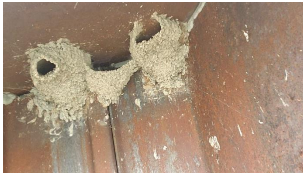
Photo 7 Deux nids complets et un nid incomplet (côté est; 20 octobre 2022)