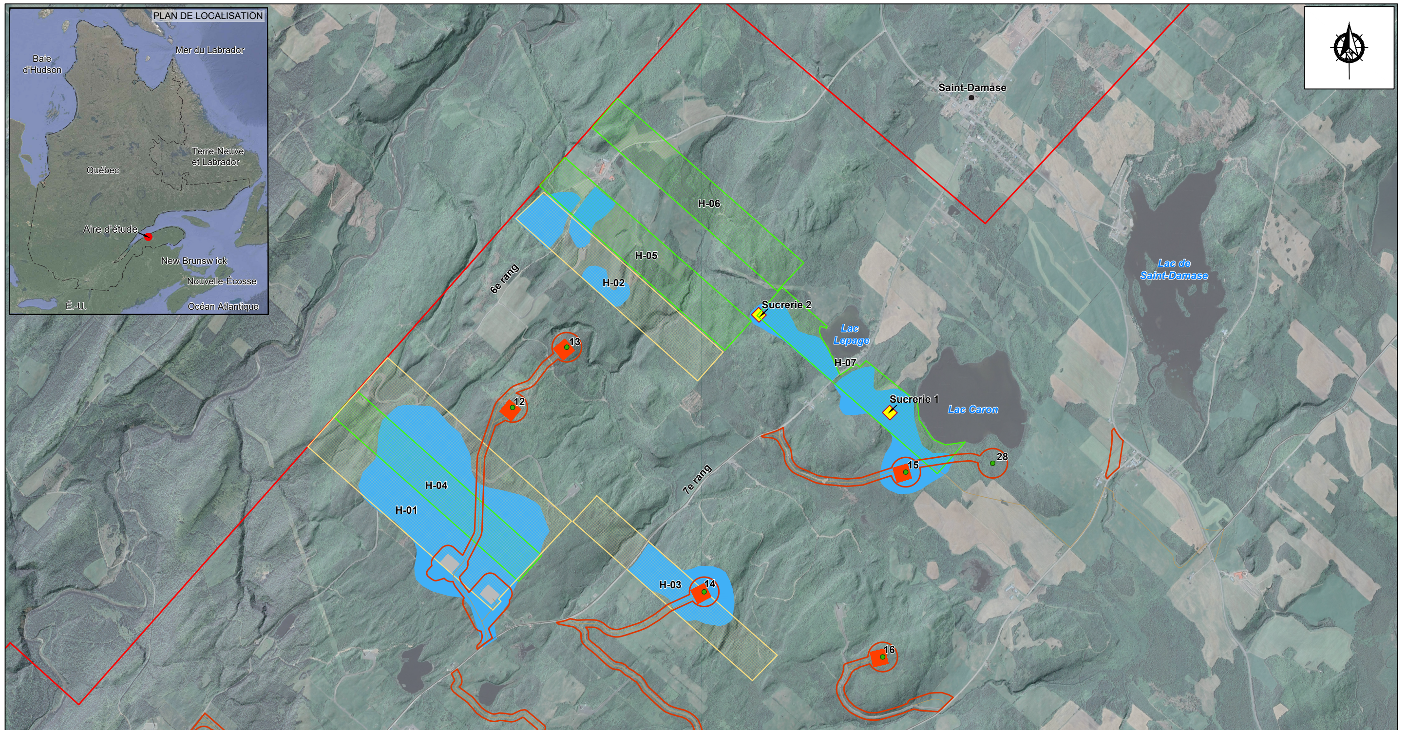
Figure 1 - Zone couverte par la prospection pédestre à la hauteur des 6 e et 7 e rangs, canton de MacNider