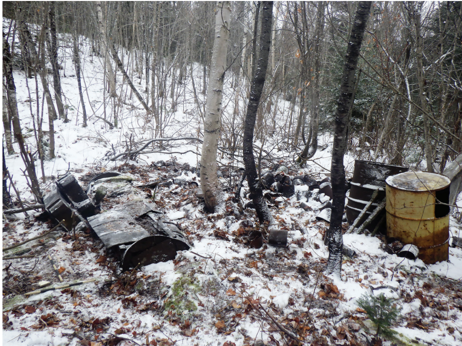
Figure 2 - Sucrierie 1. État général des lieux en direction ouest