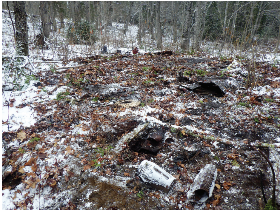
Figure 3 - Sucrierie 2. État général des lieux en direction nord