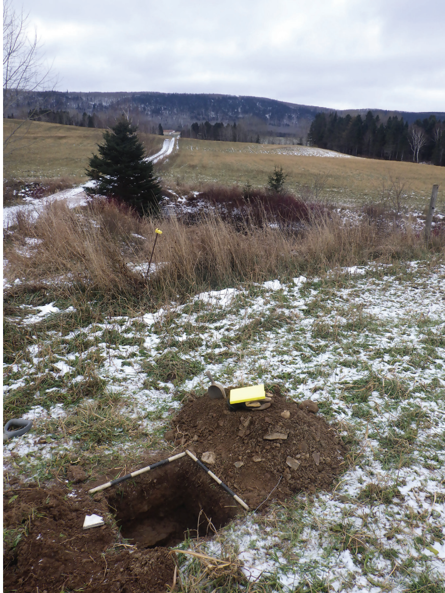
Figure 5 - État général des lieux en direction sud-est