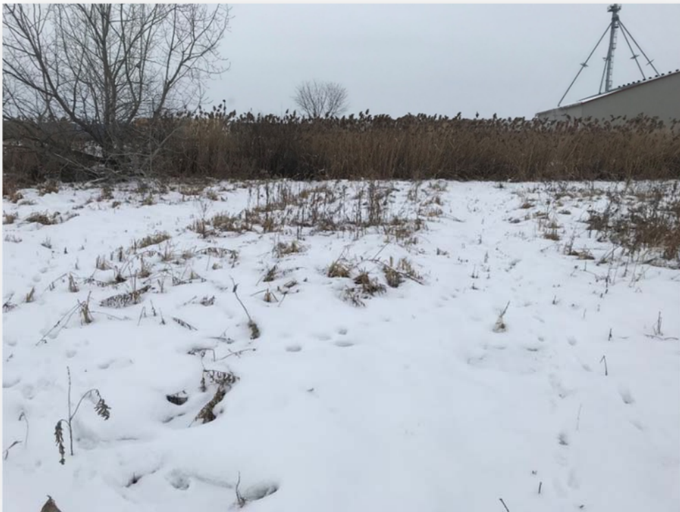
Aspect général – Parcelle 4 à Saint-Hyacinthe (2018-12-11)