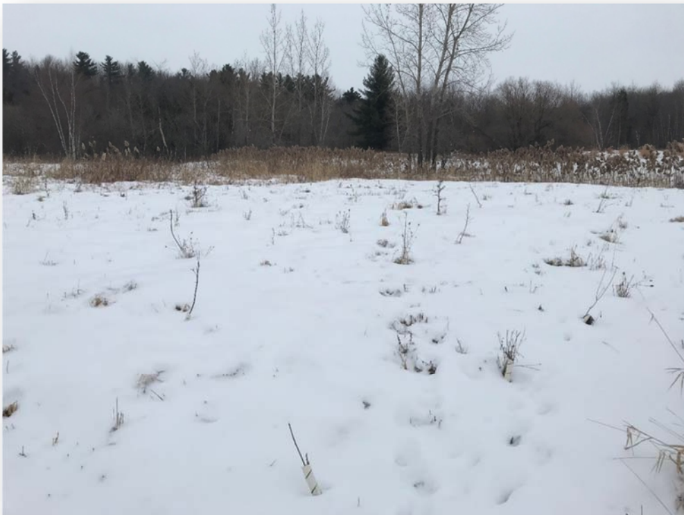
Aspect général – Parcelle 2 à Saint-Hyacinthe (2018-12-11)