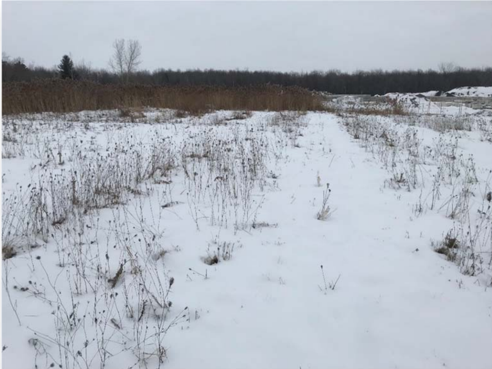
Aspect général – Parcelle 3 à Saint-Hyacinthe (2018-12-11)