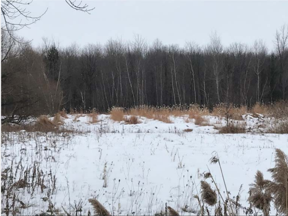
Aspect général – Parcelle 1 à Saint-Hyacinthe (2018-12-11)