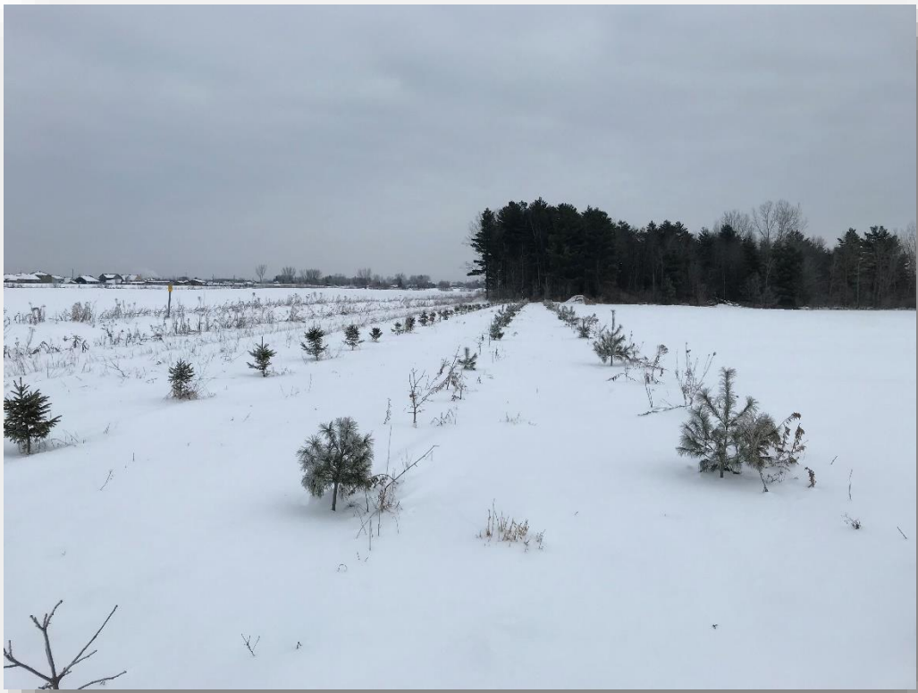
Aspect général - Parcelle 8 à Saint-Germain-de-Grantham (2018-12-11)