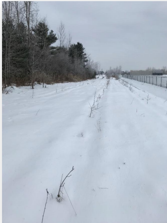
Aspect général - Parcelle 16 à Saint-Germain-de-Grantham (2018-12-11)